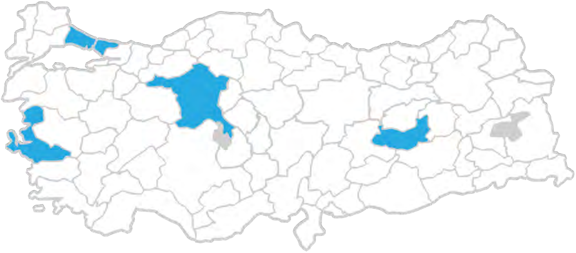
Tablo – 3 Çocuk Eğitimevlerinin Coğrafi Dağılımları (Ankara, Elazığ, İstanbul, İzmir)

Periyodik Rapordaki hapisane sayılarının ve lokasyonların yukarıdaki haritalardan farklı olması, rapor yazım tarihlerinin farklı olmasından kaynaklanmaktadır. En güncel haliyle çocuk hapisaneleri yukarıdaki tablolarda belirtilen illerde bulunmaktadır. Çocuk ve gençlik kapalı ceza infaz kurumları, tutuklu çocuklar ile hükümlü olup da disiplin cezası olarak kapalıya gönderilen çocuklar içindir. Çocuk eğitimevleri ise 'kapalıya iade' disiplin cezası uygulanmayan hükümlü çocuklar içindir. Çocuk hapisanelerinin kapasite ve lokasyonlarına göre çocuklar, geçici ya da sürekli olarak yetişkin hapisanelerinin çocuk koğuşunda da kalabilmektedir. Özellikle kız çocukları için yetişkin hapisanesinde tutulmak bir istisna değil, asıl uygulama haline gelmiştir.