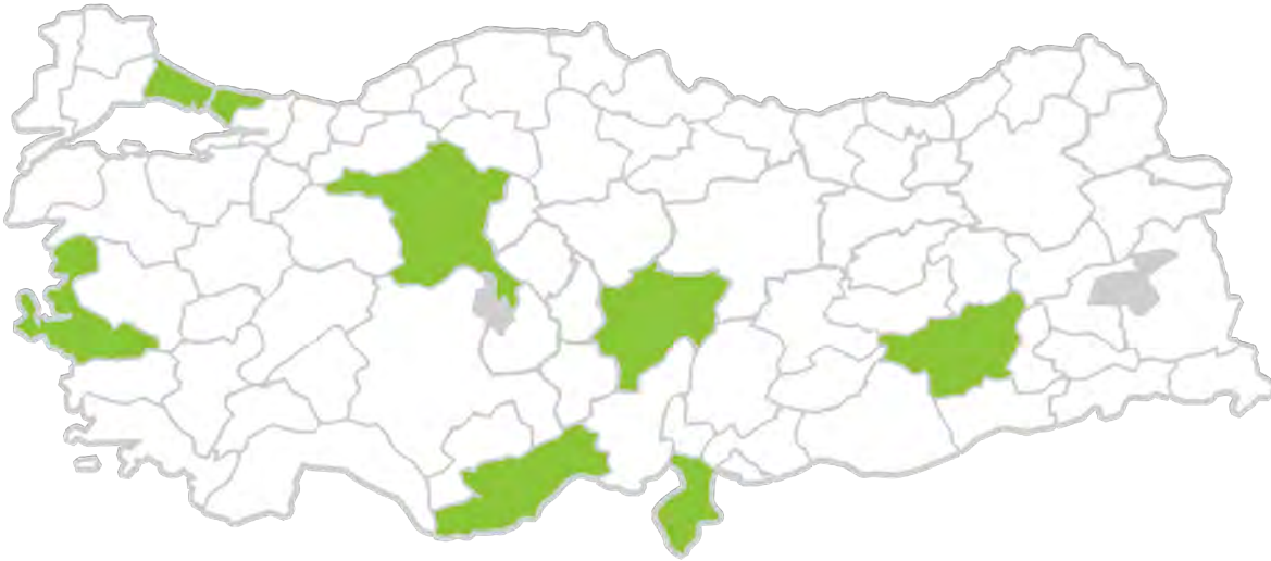
Tablo – 2 Çocuk ve Gençlik Kapalı Ceza İnfaz Kurumlarının Coğrafi Dağılımı (Ankara, Diyarbakır, Hatay, İstanbul, İzmir, Kayseri, Mersin)

Periyodik Raporda özgürlüğünden yoksun ve alıkonulan çocuklara yönelik tedbirler (madde 37 b-d) aktarılırken kurulan 5 çocuk destek merkezi (ÇODEM)'nden bahsedilmiştir. ÇODEM'lerde uygulanan bakım tedbiri, Çocuk Koruma Kanunu'nda yer alan koruyucu ve destekleyici tedbirlerden 14 biridir. BMÇHS madde 37 kapsamında çocuğu "özgürlüğünden yoksun bırakan" bir uygulama olarak anılması, koruyucu ve destekleyici tedbirlerin çocuk adalet sistemindeki yeri ile ilgili bir politika sorununa da işaret eder. BMÇHS madde 37 kapsamına göre özgürlüğünden yoksun bırakılan çocuklar; Aile Bakanlığı çatısı altındaki ÇODEM'lerde değil, Adalet Bakanlığı çatısı altındaki çocuk ve gençlik kapalı ceza infaz kurumları ile çocuk eğitimevlerinde tutulmaktadır. 15